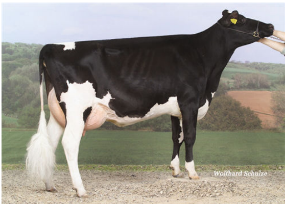
KONNY FIFTH DAM