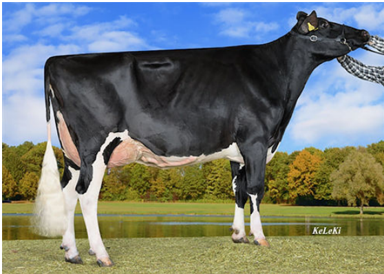
WILDER HERZ-P GRANDDAM