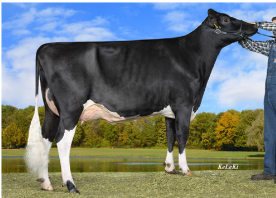
WILDER HERZDAME-P DAM